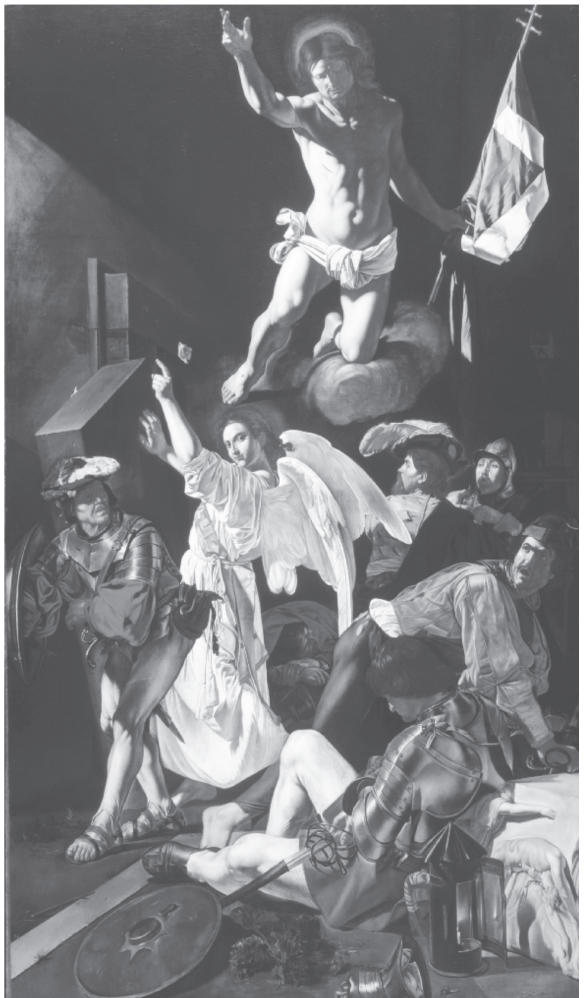
Cecco del Caravaggio: Feltámadás (1619), Chicagói Művészeti Intézet

Valaki lépked, felfelé tart. Bozót közt víg madársereg. Valaki lassan felfelé tart. Tövisről vérharmat csepeg. Valaki fel, a csúcs felé tart, hogy önmagát feszítse meg.